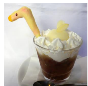
天を切り裂く！白鳥パフェ