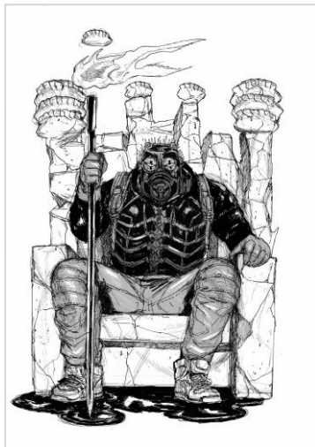
モノクロ原稿 ©林田球/小学館