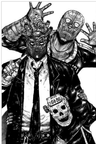
「ドロヘドロ」魔のおまけ特別編表紙イラスト ©林田球/小学館