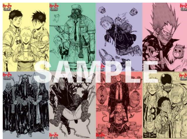
入場特典イメージ ©林田球/小学館

入場されたお客様に、入場特典『イラストカード』を全8種からランダムで1種プレゼントします。 無くなり次第、配布は終了します。