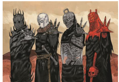
「ゲッサン」2021年5月号表紙イラスト ©林田球/小学館