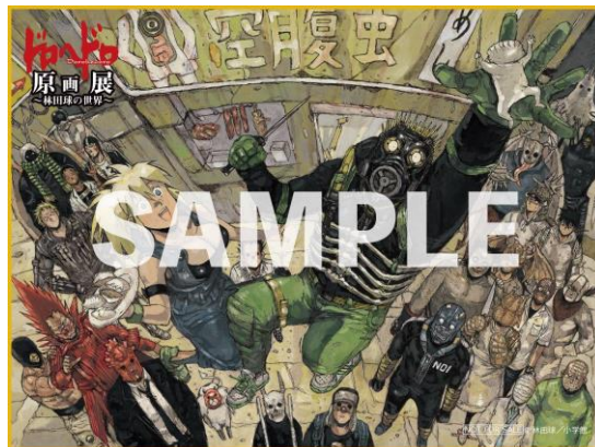
限定デザイン色紙イメージ

(WEB 申込み: https://eplus.jp/dorohedoro/ 、 ファミリーマート店舗)