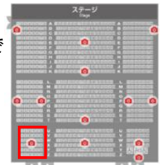
真っ暗にならない席 (赤印が該当ブロック)

◎概要:本公演は「お子様が泣いても席を立たずにご鑑賞いただける公演」としています。「はじめてで泣いてしまったらどうしよう…」といった不安をお持ちのお客様も、最後まで安心してご鑑賞いただけます。途中退出も可能です。公演中のスタッフへの声掛けも積極的に受け付けます。 また、一部エリア(U列～Z列・1番～6番)は公演中も明るさを保って上演します。暗い場所に不安があるお客様は、「真っ暗にならない席」を選択し、ご購入ください。「真っ暗にならない席」は出口に近いお座席となります。