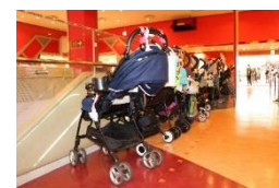
当日の様子(エントランス)