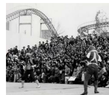
仮面ライダーショーの様子 ©石森プロ・東映

後樂園ゆうえんち時代に仮面ライダー2号が登場した第1回公演(1971年)の開催以降、ヒーローショーは長きに渡ってこの地で愛されてきました。ヒーローショー準専用屋内劇場として姿を変えた『シアターG ロッソ』では、2021年秋にヒーローショー開催50周年迎えました。