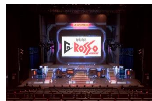
プロジェクションマッピング

また、シアターG ロッソでは、新型コロナウイルス感染症拡大防止対策のため、“「声援」に代わってペンライトの「光」でヒーローを応援する演出”を引き続き実施します。今年度はペンライトが暴太郎戦隊ドンブラザーズ仕様にアップデートし、自動制御で色や光り方を変化させることで、会場一体となってヒーロー達を応援することができます。(ペンライトをお持ちでなくても、公演をお楽しみいただくことは可能です。)