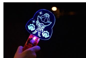
G ロッソオリジナル ドンブラザーズペンライト

約 7.5m(3 階相当)の高さからステージの奈落に飛び込んだり、ワイヤーアクションでステージを飛び回ったり、ヒーローショー準専用劇場であるシアターG ロッソの舞台装置ならではの、迫力あるアクションが繰り広げられます。ステージと客席の距離が近く、テレビで活躍するヒーローたちの華麗で迫力ある 3 次元のアクションを、間近でお楽しみいただけます。