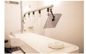
ヴィシーシャワー イメージ