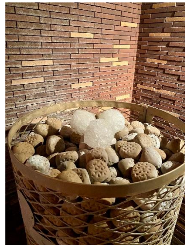
キューゲル イメージ