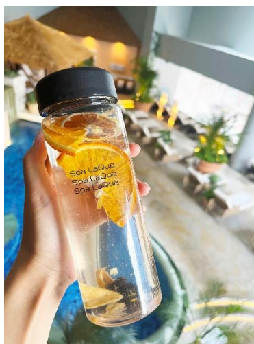
フォンダンウォーター イメージ