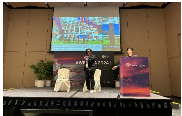
「ウルトラ調査隊」の説明の様子