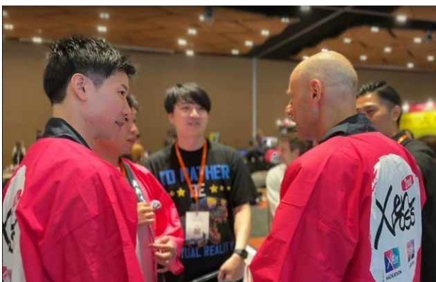
2日間で120人が参加、参加者から多くの質問が飛んだ

XRアトラクションのティザー映像: https://www.youtube.com/embed/zIWG6VTTf64?feature=oembed