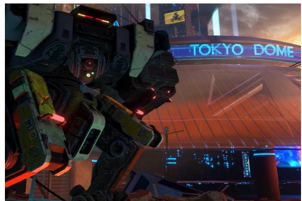
XRアトラクションの映像イメージ