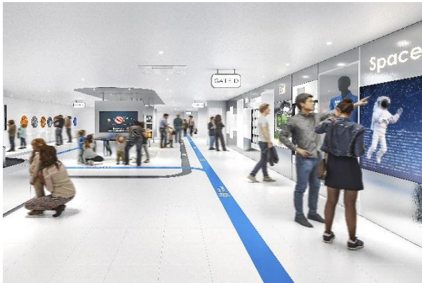
新宇宙体験施設「Space Travelium TeNQ」館内イメージ

施設詳細情報： https://www.tokyo-dome.co.jp/tenq/