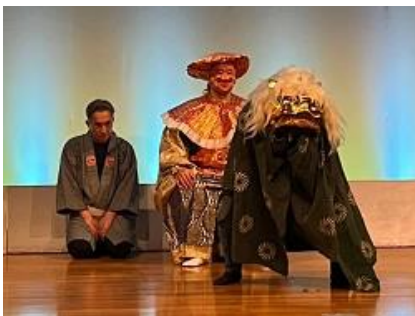
神田囃子・寿獅子

大福・幸福・裕福の三つの福が一体になった縁起の良い「三福団子」など“和”の軽食やお飲み物をお楽しみいただけます。