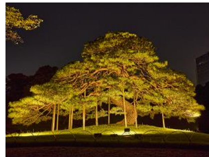
今回の見どころの一つ 「一つ松」

前回開催のエリアをさらに拡大し、ライトアップだけでなく、庭園の歴史を辿るプロジェクションマッピングやフード&ドリンクの販売なども行います。また、10月6日(日)は1日限定で、幻想的な空間を演出する「灯籠流し」を開催します。秋の夜長を、当時の諸大名も過ごしたであろう宴の夜に思いを馳せ、心温まる「光の世界」をお楽しみください。皆様のご来園をお待ちしております。