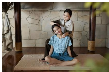
エステ&リラクゼーション イメージ