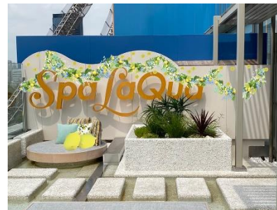
館内装飾 イメージ

館内のレストラン&カフェでは、レモンを主役にした、さまざまな飲食メニューを提供します。