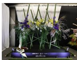
志穂美悦子さん作品