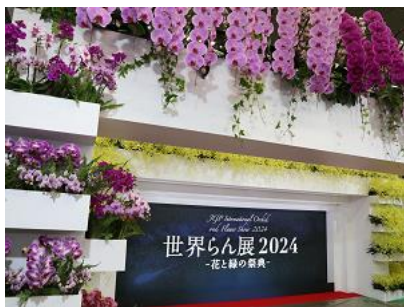
オーキッド・ゲート 2024

漆黒の夜空に星のように球体の蘭が浮かびます。真夜中の静寂の中に、蘭が幻想的に浮かび上がる展示は夜でも変わらぬ蘭の美しさを表現しています。