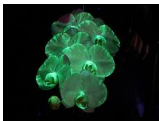
光るコチョウラン

会場には毎年人気の展示を始め、世界初公開となる、遺伝子組み換えによって開発に成功した、ブラックライトの下で幻想的に輝く『光るコチョウラン』や、九州南部から沖縄にかけて見られる「オキナワチドリ」や「イリオモテラン」など、南西諸島の貴重な蘭を集めた展示「自然の楽園 南西諸島に咲く蘭」が初登場します。さらに、世界らん展の目玉である展示即売ブースには、4年ぶりに海外からの出展が復活します。ペルー、エクアドル、台湾など合計7か国・地域の生産者が集まり盛りだくさんの内容となっております。