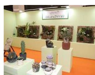
NHK『趣味の園芸』 “これ、かっこイゼ！”