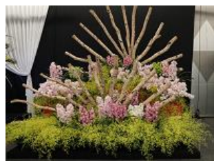
假屋崎省吾さん作品