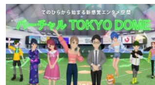
バーチャル東京ドーム

https://www.tokyo-dome.co.jp/virtual_tokyodome/