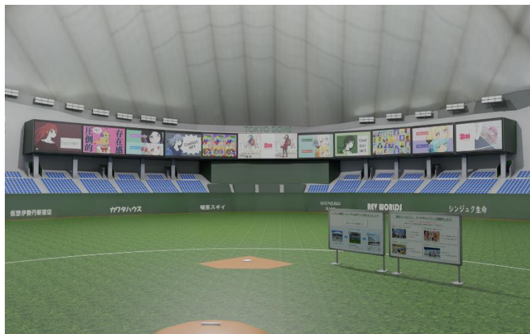
掲出イメージ(バーチャル東京ドーム内)

当社は、『バーチャル東京ドーム』の看板という新たな空間資源に NFT アートを表現することで、『バーチャル東京ドーム』ならびにそこを活用するクリエイターのみならず、NFT 業界全体が飛躍する可能性がある取り組みのひとつと捉えております。この取り組みを通じ、国内の NFT 市場の盛り上がりを創出することで、日本のクリエイターが世界に羽ばたく土壌をつくり、新たな時代のエンターテインメント文化の発展に寄与してまいります。