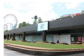
アベニューAaMo ビジョン

※東京ドームシティ内の催事およびメンテナンス等の都合により、放映されない時間帯がございます。