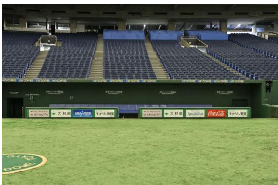
ベンチ防球フェンス