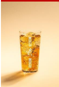
ジョニーハイボール&ジンジャー スパイシーなジンジャーエールが 相性抜群な海外で人気の一杯。