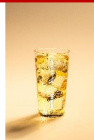
ジョニーハイボール&ウメ スモーキーさと梅酒の甘酸っぱさを 味わう、さっぱり系和風ハイボール。