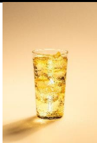
ジョニーハイボール ブラックラベル 12 年の奥行きある 味わいをまっすぐ楽しむ一杯。