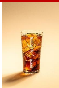
ジョニーハイボール&コーラ 定番のウイスキーコークを、 ひと味ちがうスモーキーな味わいで。