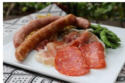
YONA YONA SET イメージ