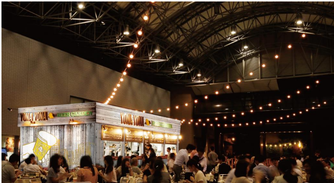
開催イメージ:「ARK Hills Ale 2019」をモチーフしたウォールアートのあるビール・フード提供スペース