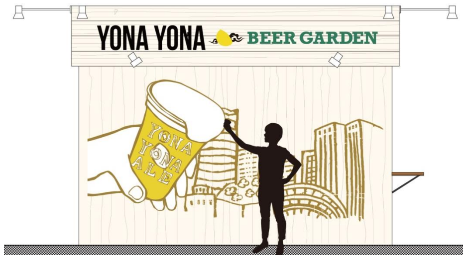
ウォールアートの前で乾杯写真はいかがですか