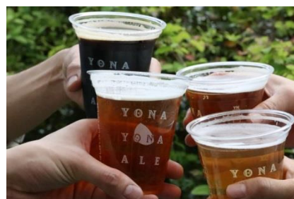
飲み放題イメージ