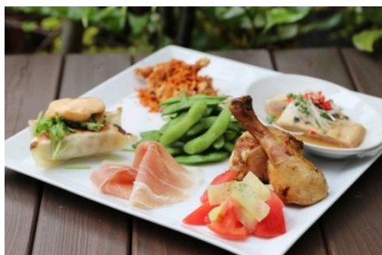
BEER FRIENDLY PLATE イメージ