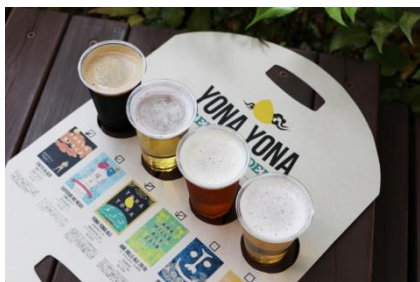
4 種の飲み比べセットイメージ