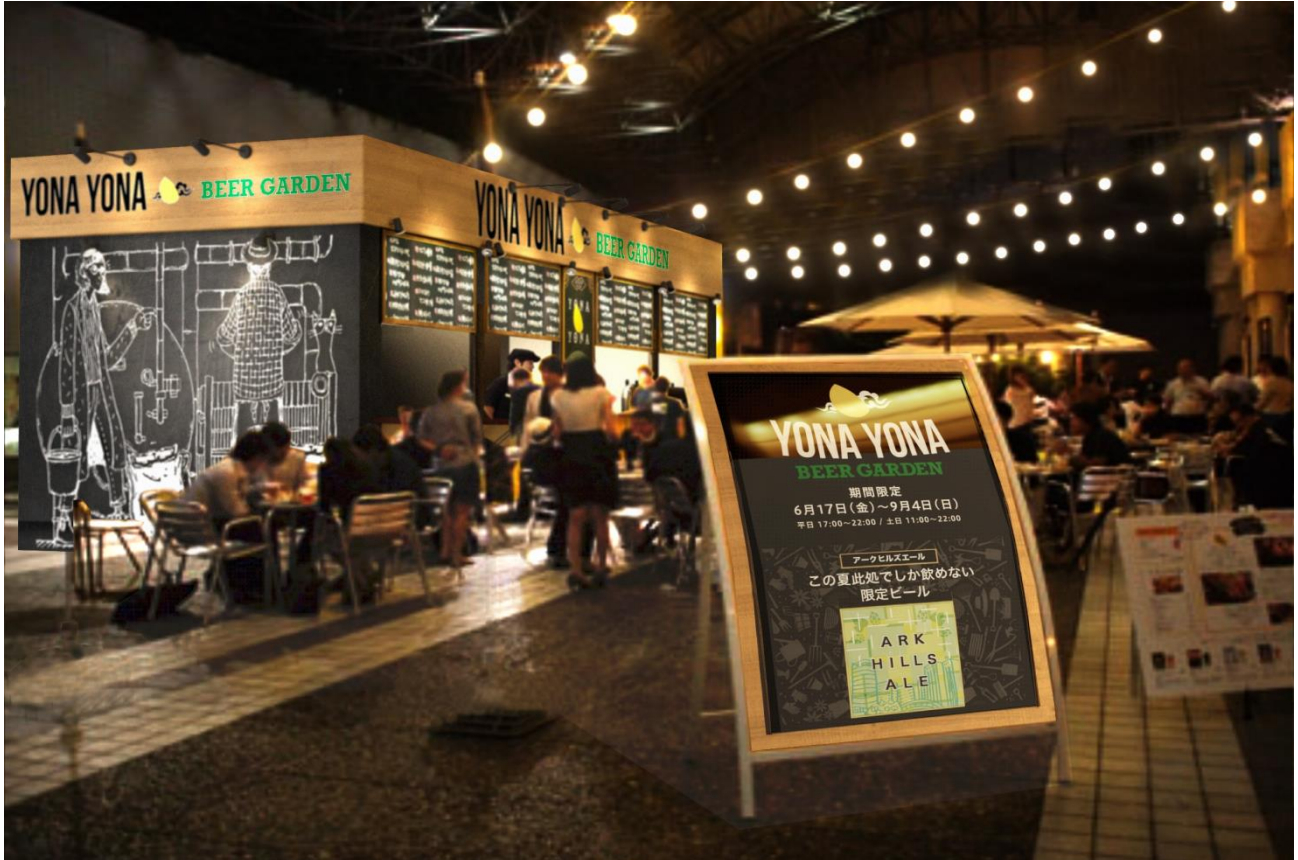
※イメージ写真です。