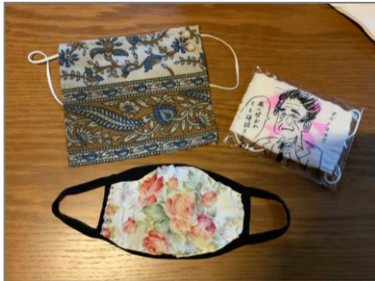
生徒たちが作ったサステナブルマスク