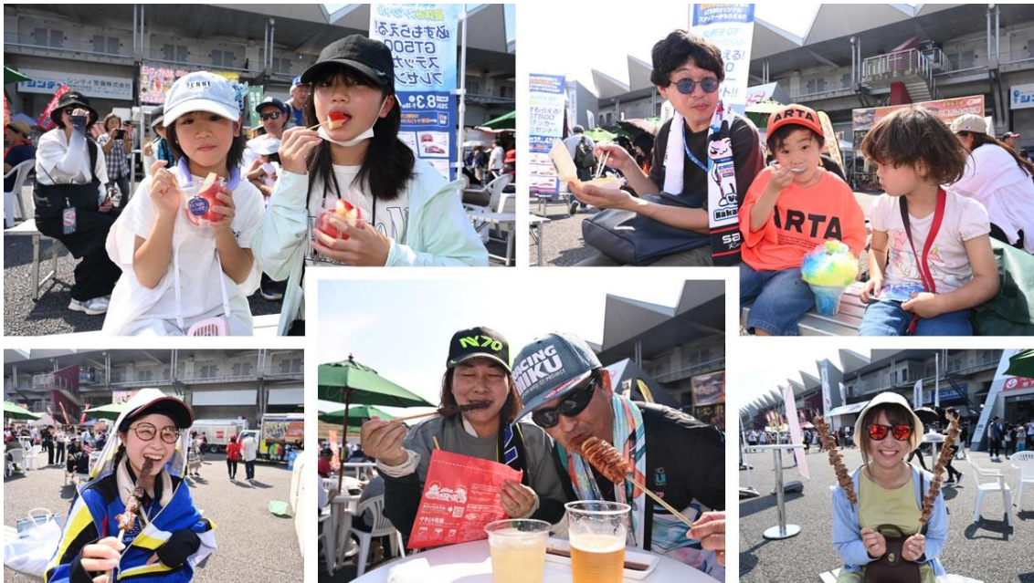
昨年 8 月に開催した SUPER GT Round 4 富士大会 イベント広場での様子