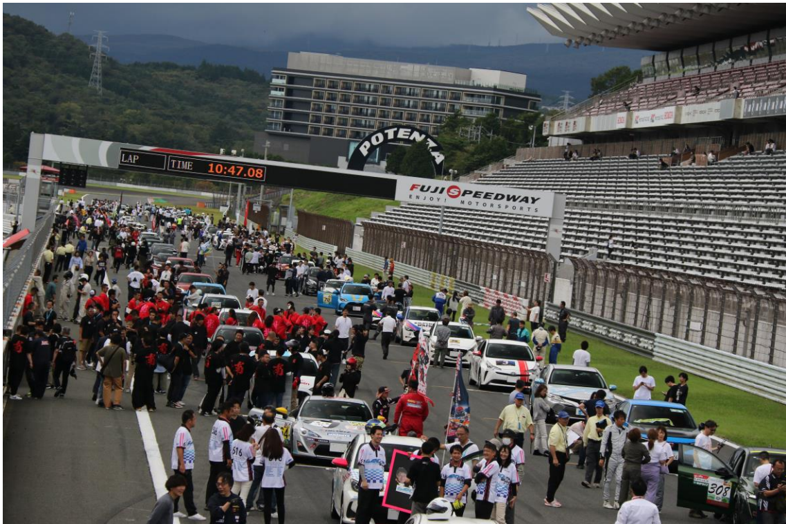
スタート前、グリッド上での記念撮影などをお楽しみください。