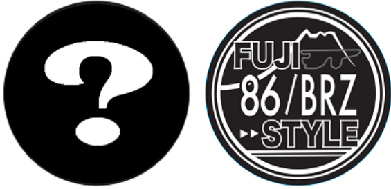
マグネットシート 直径86mm