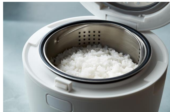
<ヘルシーマルチライスポット 12,980円(税込)>