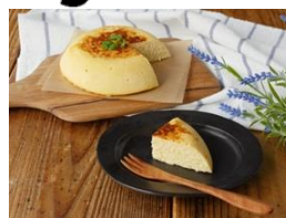
<ヨーグルトおからケーキ>