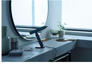
シックな香り漂うブラック