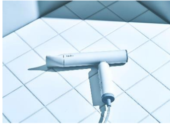
爽やかでクリーンな印象のホワイト

カラーバリエーションは、ホワイト・ブラックに加え、Re・De Pot や Re・De Kettle で好評であったヒュッケグレーをご用意しました。性別を問わず、長く使うことのできる絶妙な色味にこだわっています。