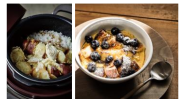
左<炊き込みごはん> 右<熱々瞬間パンプディング>

期 間：2022年6月25日(土)・26日(日) 15:00~18:00 場 所：b8ta Koshigaya Laketown 内 キッチンスペース (〒343-0828 埼玉県越谷市レイクタウン4丁目 kaze 2階 C-205 2番地2 イオン) 内 容：「さつまいものゴロゴロ炊き込みバターごはん」 レシピ詳細 https://re-de.jp/pot/recipe/special/special_01/03/ 「熱々瞬間パンプディング」 レシピ詳細 https://re-de.jp/pot/recipe/special/special_06/04/