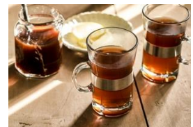
<いつでも紅茶シロップ>

期 間：2022年6月18日(土)・19日(日) 15:00~18:00 場 所：b8ta Tokyo – Shibuya 内 カフェスペース (〒150-0002 東京都渋谷区渋谷1丁目14番11号 小林ビル1階) 内 容：「いつでも紅茶シロップ」を使ったオリジナルドリンク レシピ詳細 https://re-de.jp/pot/recipe/special/special_06/06/