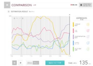
脳波計測機で計測した結果