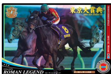
●「☆」3つの「レア」騎手」カード以上がホログラム仕様

カード表面のデザインには、所有オーナーの勝負服デザインを取り入れ、競馬ファンにとってさらにコレクション性の高いものへと進化させました。キラ仕様もさらに豪華になり、「SSS レア」「LH(リーディングホース)レア」といった新規レアリティも増設しております。新1弾のカードラインナップは今年80周年を迎える「日本ダービー特集」を中心に全126種でお届けいたします。