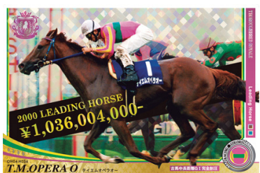
●新1弾だけの特殊加工レア「LH(リーディングホース)レア」