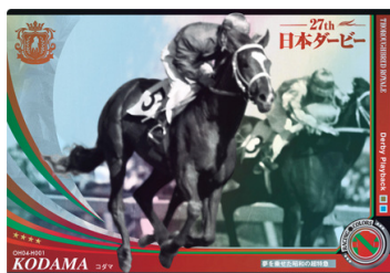
●ダービー80周年記念「Derby Playback」