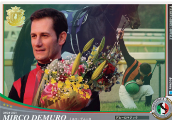
●外国人騎手初登場! 「Jockey」