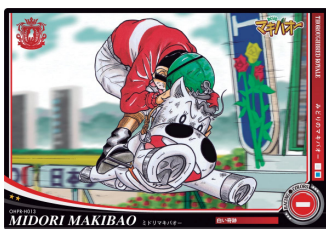
●ミドリマキバオー

また、週刊プレイボーイ9号(2月18日発売)付録として、「たいようのマキバオー」「たいようのマキバオーW」主人公「ヒノデマキバオー」のカードが登場し、ゲーム内を漫画さながらの姿で駆け抜け、レースを一層盛り上げます。