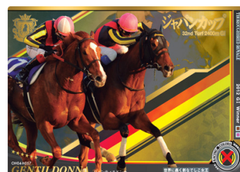
●新登場の最上級レア「SSSレア」