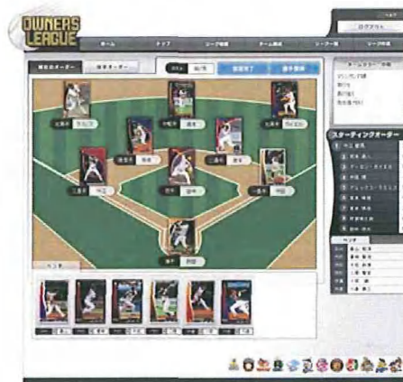
(画像) ゲーム画面 一例

「俺・オールスター」によるペナントレースがスタート。リアル野球シミュレーションが自動で進行していきます。