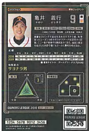
(画像) カード裏面 一例