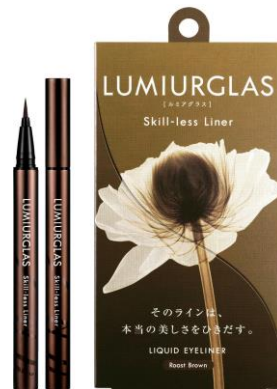
映像内にて使用していた 02.【ローストブラウン】

店頭で選んだ「02.ローストブラウン」のアイライナーを手に、控室に戻ったあのさん。鏡を前に『僕手が震えちゃうんですよ、メイクするとき』と緊張気味な姿を見せながら、アイラインを引きます。『アイシャドウの上からでも乾くの早いし、キープが長いので、最強説。』と、某番組を連想させる感想で、スキルレスライナーの使いやすさを語り、無事にリポーターとしてのお仕事を終えたあのちゃんでした。本動画では、あまり見ることのできない、貴重なあのちゃんのメイク風景にもご注目ください。