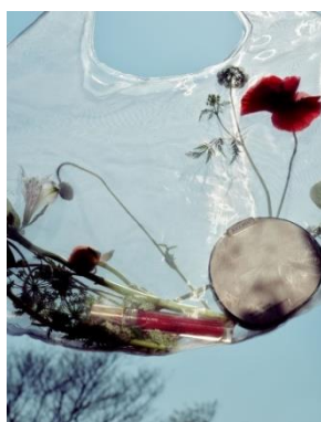
ブランド名：Joocyee（ジューシー） 国名：中国 商品名：シルクマルチパレット 価格：3,740円（税込）