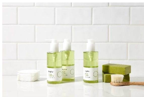
ブランド名：beplain（ビープレーン） 国名：韓国 商品名：緑豆クレンジングオイル 価格：3,480円（税込）