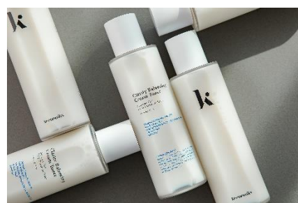
ブランド名：keenoniks（キノニクス） 国名：韓国 商品名：クラリティバランシングクリームトナー 価格：150ml/3,520円（税込）

オープン同日には、『LAOX BEAUTY AIRPORT』のオンラインストアがスタートします。オンライン上でも、『LAOX BEAUTY AIRPORT』の世界観を表現し、お客様のコスメ・ビューティーの旅路をサポートいたします。今後、実店舗とオンラインストアの連携を加速させ、お客様がどちらの店舗をご利用いただいてもスムーズにお買い物ができるシームレスなショッピング体験の提供を目指します。また、公式アプリも新たにご用意し、新商品やキャンペーン、お得なクーポンなど、