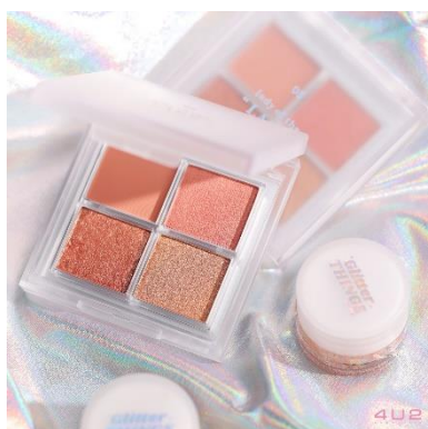
ブランド名：4U2（フォーユーツー） 国名：タイ 商品名：4U2 アイシャドウパレット 価格：968円（税込）