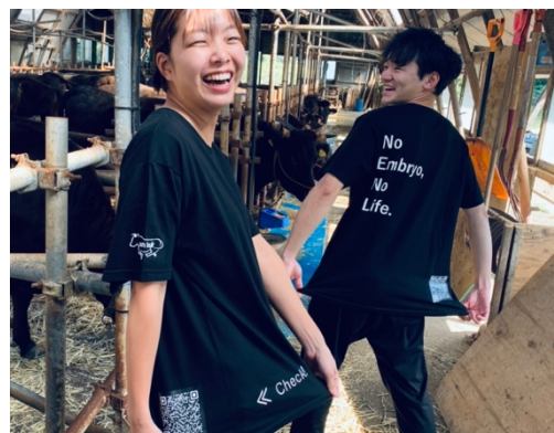
当日のスタッフTシャツに記載のQRから公式サイトをチェック！