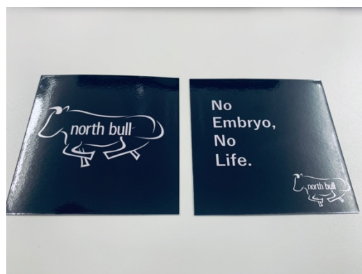
体験ブース参加者に配布するステッカー