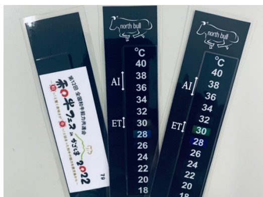
公式LINE登録済みの畜産・酪農関係者に配布する液晶温度計