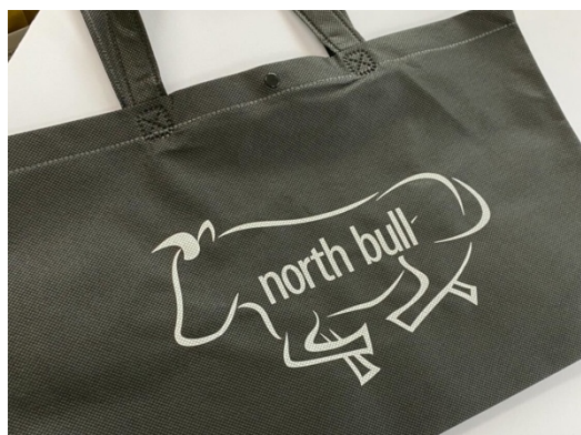
SNSで発信してくれた方1日先着50名に配布するエコバッグ