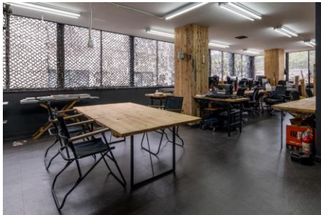
オフィスは日当たりもよく開放的