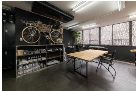
出会った者同士での会議も可能