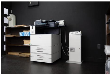
マルチ複合機も完備