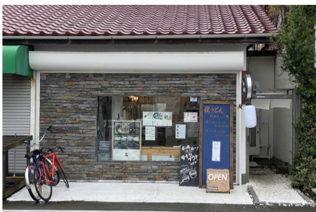
こがね製麺所 湘南店