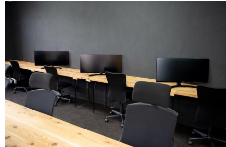
34インチのモニターも使用可能