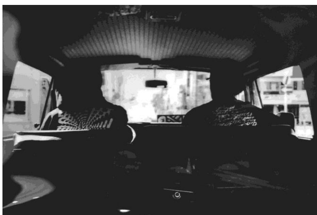
Lifestyle brand 877