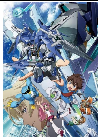
ガンダムビルドダイバーズ