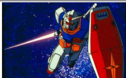
機動戦士ガンダム HD リマスター