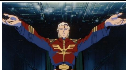
機動戦士ガンダム 逆襲のシャア