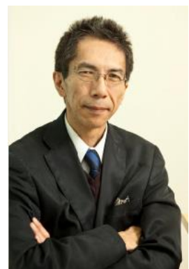
＜澤口俊之氏＞ (人間性脳科学研究所所長)

『たまろくと人図鑑』は、たまろくと(多摩六都:小平市、東村山市、清瀬市、東久留米市、西東京市)で活躍する地域の「人」にスポットを当てた対談番組として2016年6月にスタート。番組MCを有賀達郎氏(元FM西東京社長)が担当し、毎週地元の経営者や文化人、スポーツ、芸術など幅広い分野で活躍するゲストをスタジオにお迎えし、「現在の活動」「生い立ち」「今後の展望」をキーワードにトークを展開しています。今年5月に出演ゲストが 100 人を突破したことを記念して開催する本イベントでは、脳の育成分野で有名な脳科学者・澤口俊之氏に、地域がより豊かになる方法などについて脳科学の観点からわかりやすく講演いただくほか、後半には「地域を豊かにする情報とは？」をテーマに、小平、東村山、清瀬、東久留米、西東京 5 市長と澤口氏によるトークセッションも行われます。さらに公開収録後、過去の出演ゲスト 100 人による交流会も実施され、「たまろくと人」が一堂に会します。