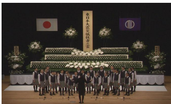
昨年の追悼式の様子

J:COMは、本番組の放送を通じて、“地域メディア”として地域の皆さまへの防災に対する意識を喚起し、震災地の復興を支援し続けるとともに、地域の活性化に向けて貢献してまいります。