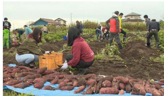
3.11 震災特別番組『農村再生』