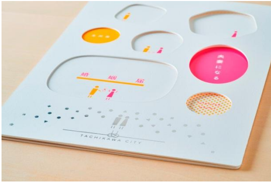
立川市プレミアム婚姻届(立川市/立川市)