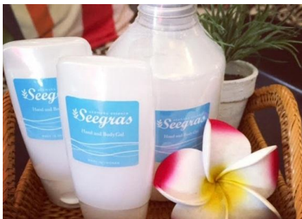
Seegras アカモク ハンド&ボディジェル(KopiLuwak/廻子市)