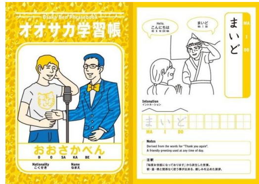
オオサカ学習帳(リンクコーポレーション/大阪市)