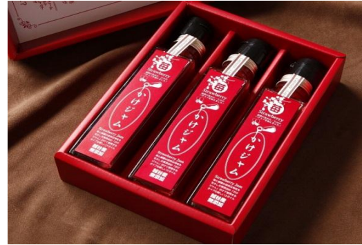
苺のかけジャム(地場野菜イタリアン カポナータ/越谷市)