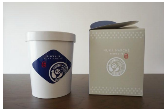
NUKAMARCHÉ(ヌカマルシェ)(草竹農園/阪南市)