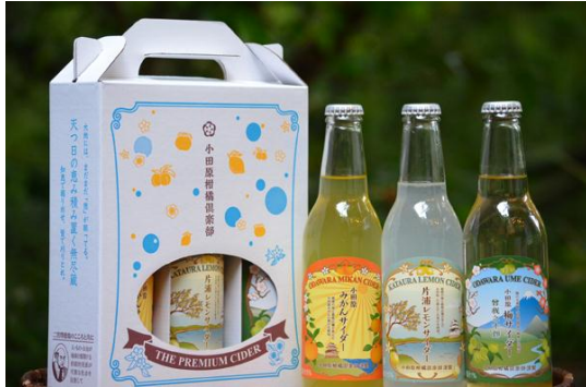
㈱小田原柑橘倶楽部(小田原柑橘倶楽部/小田原市)