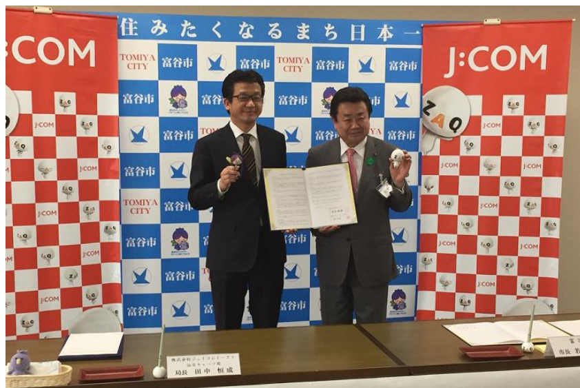
<2017年4月17日締結の様子>

J:COM 仙台キャベツは今後も、地域の安全・安心なまちづくりにさらに貢献してまいります。