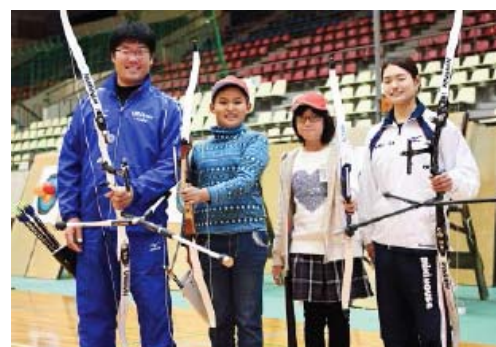
近畿大学でのアーチェリー体験講座の様相