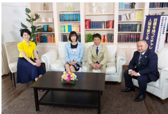
『オリンピック・パラリンピック教育の可能性』

J:COMは今後も地域メディアならではの番組作りを通じて、地域情報の発信と、地域の活性化に貢献して参ります。