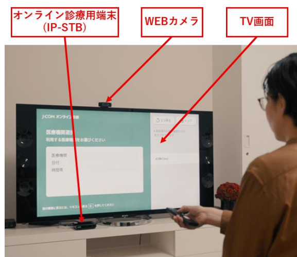
患者側の利用シーン

岐阜大学医学部附属病院、関ヶ原町、大垣ケーブル、J:COMは、産官学が連携しデジタルの力で医療をはじめとした地域課題の解決を進め、地域高齢者の医療アクセスの改善、健康管理の向上と地域医療の持続的な発展・活力ある地域社会の形成に貢献してまいります。