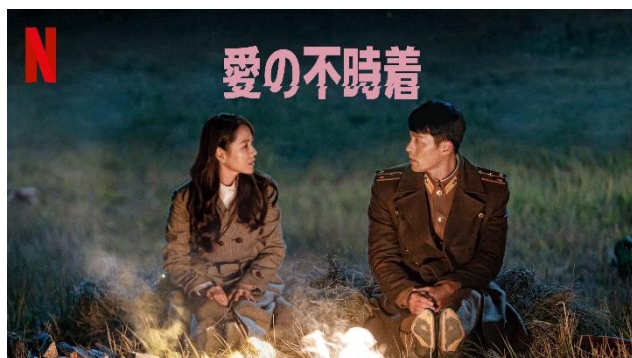
Netflix オリジナルシリーズ「愛の不時着」 (配信中)

Netflixで話題のドラマシリーズも「J:COM TVフレックス」で簡単に視聴が可能！