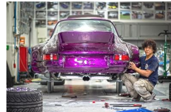
MONDO TV 「カリスマチューニング ～ボルシェ～」 TM & © 2020 Turner Japan.