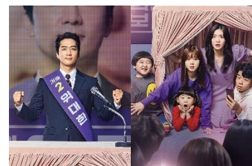
女性チャンネル♪LaLa TV 「偉大なショー～恋も公約も守ります!～」