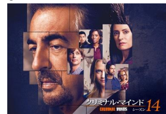
スーパー! ドラマ TV 「クリミナル・マインド」