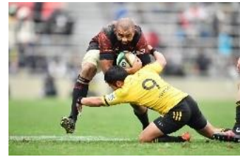
J SPORTS 1 「ジャパンラグビー トップリーグ 2021」