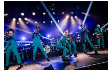
SPACE SHOWER TV 「TOKYO SKA JAM 9+ ～ライブハウス編～」