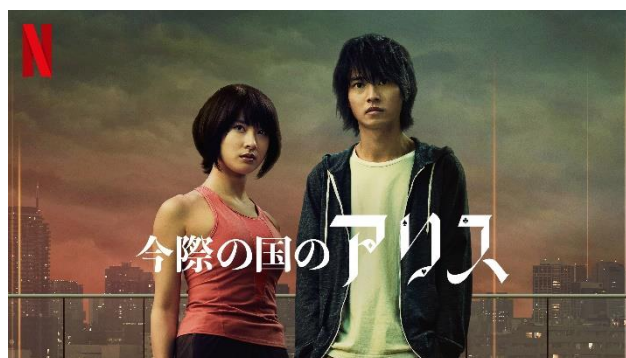
Netflix オリジナルシリーズ「今際の国のアリス」 (2020年12月10日独占配信開始)