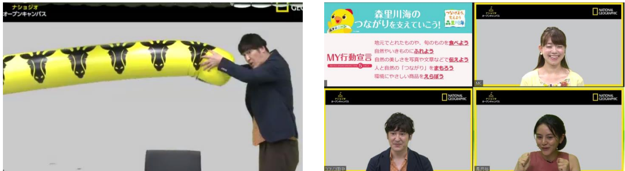
6月に行われた「ナショジオ オープンキャンパス オンライン校」の様様

ナショナル ジオグラフィックが企画する、地域の企業、行政、大学と連携し、親子参加型のイベントなどを通して環境保護を推進していくプロジェクトです。タレント・俳優として活躍し、芸能界随一の動物好きとしても知られるココリコ田中直樹さんをナビゲーターとして迎えて開催します。