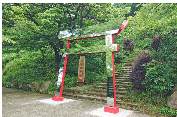
曾我浅間神社 鏡の鳥居

Instagram： https://www.instagram.com/acaoforest