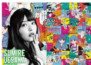
声優 上坂 すみれ