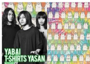
3人組自称メロコアバンド ヤバイTシャツ屋さん