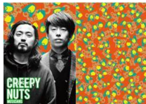
ヒップホップユニット Creepy Nuts (R-指定 & DJ松永)