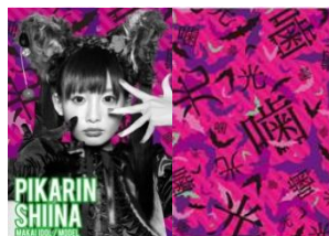
モデル・魔界人アイドル 椎名 ぴかりん