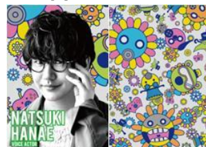
声優 花江 夏樹