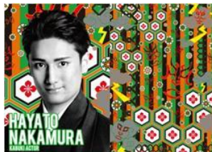
歌舞伎俳優 中村 隼人