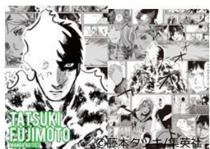
漫画家 藤本 タツキ