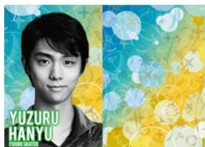
フィギュアスケーター 羽生 結弦

未来への原動力「夢を持つ事」や、好きな楽曲「ジュピター」より、キラキラ輝くデザインにしました。好きなハートやスターの要素に、ピンク色を合わせて、自分らしく表現しました。