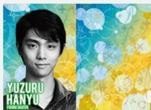
フィギュアスケーター 羽生 結弦

ロッテ「キシリトールガム」と新たな未来をつかっていく若者20組。様々なジャンルから選定した彼らと、新たな可能性に挑戦します。