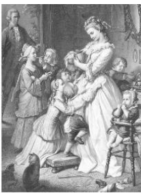
社名の由来である “若きウェルテルの悩み”のヒロイン 「シャルロッテ」