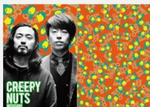
ヒップホップユニット Creepy Nuts (R-指定 & DJ松永)