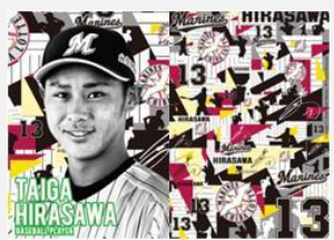
プロ野球選手 平沢 大河