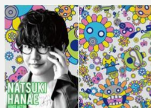
声優 花江 夏樹