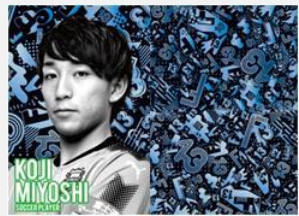
プロサッカー選手 三好 康児