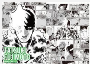
漫画家 ©藤本タツキ/集英社 藤本 タツキ