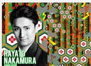
歌舞伎俳優 中村 隼人