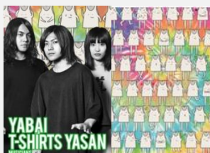
3人組自称メロコアバンド ヤバイTシャツ屋さん