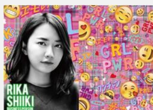
実業家 椎木 里佳