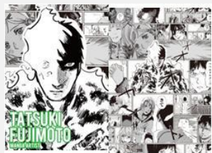
漫画家 ©藤本タツキ/集英社 藤本 タツキ