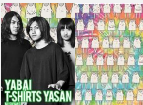
3人組自称メロコアバンド ヤバイTシャツ屋さん