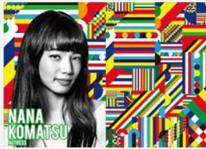
女優・モデル 小松 菜奈