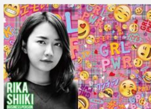
実業家 椎木 里佳