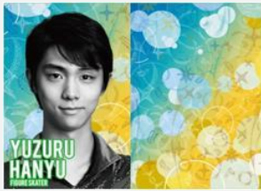
フィギュアスケーター 羽生 結弦

ロッテ「キシリトールガム」と新たな未来をつくっていく若者20組が決定しました。様々なジャンルから選定した彼らと、新たな可能性に挑戦します。