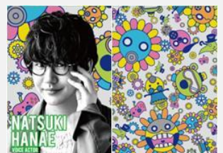
声優 花江 夏樹