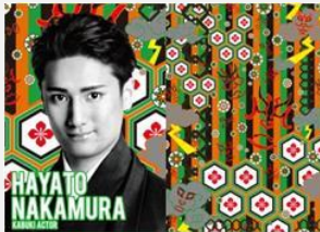
歌舞伎俳優 中村 隼人