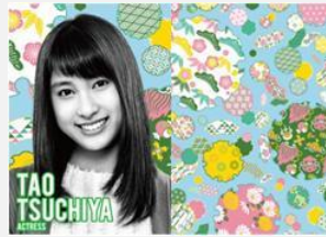
女優 土屋 太鳳