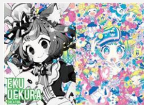
イラストレーター 上倉 エク