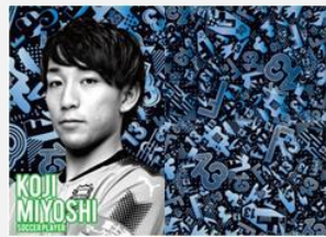
プロサッカー選手 三好 康児