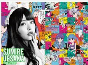
声優 上坂 すみれ