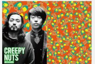
ヒップホップユニット Creepy Nuts (R-指定 & DJ松永)