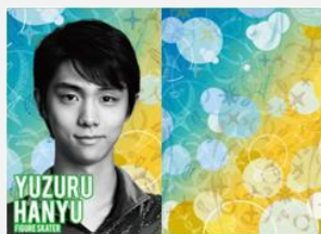
フィギュアスケーター 羽生 結弦

ロッテ「キシリトールガム」と新たな未来をつくっていく若者20組が決定しました。様々なジャンルから選定した彼らと、新たな可能性に挑戦します。