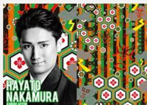
歌舞伎俳優 中村 隼人

近い未来に向けて、もっと僕のことを多くの人に知ってもらいたい。日本だけでなく、海外でも仕事をして、老若男女いろんな人を笑顔にしていきたい。そんな思いでデザインに挑戦してみました。顔の中には、僕の顔もこっそり混じっているの、見つけてみてくださいね。