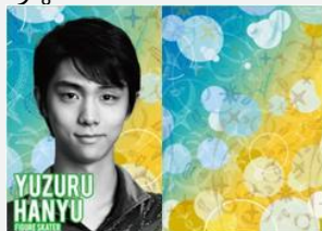
フィギュアスケーター 羽生 結弦

ロッテ「キシリトールガム」と新たな未来をつくっていく若者20組が決定しました。様々なジャンルから選定した彼らと、新たな可能性に挑戦します。それぞれがデザインに込めた思いもご紹介いたします。