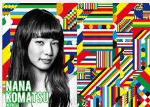
女優・モデル 小松 菜奈

名前の「羽生」から未来にはばたく「羽」と金メダルの「金」をモチーフに、フィギュアの衣装のようなデザインにしました。