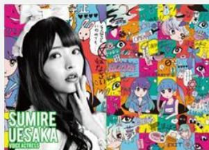
声優 上坂 すみれ

大好きな「ガスマスク」と自分の名前に入っている「花」をモチーフに、未来の悪者と戦う正義をイメージしたキャラクターをデザインしてみました。