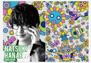
声優 花江 夏樹

魔力高まるキシリトール！甘い闇に吸い込まれるようなデザインにしました。じゅる。そんな思いから、JCJKの間で流行っているコト・モノ・コトバをちりばめた女子中高生文化を活かしたデザインを作ってみました。