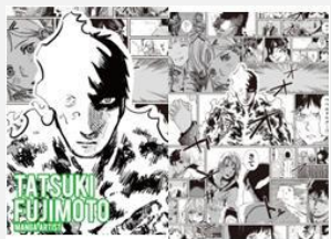
漫画家 藤本 タツキ

女の子2人が穴から覗き込んでいて、真ん中のスタートボタンを押すと、未来の世界が動き出す、そんな世界観をイメージして、デザインさせていただきました！