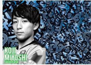
プロサッカー選手 三好 康児

未来に向けて、全ての技術をレベルアップし、マリーンズの顔として活躍する選手になりたい。「13番」といえば平沢といわれる、球界を代表する選手になりたいという気持ちをデザインに込めました。