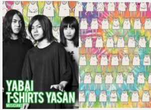
3人組自称メロコアバンド ヤバイTシャツ屋さん

ヤバTのオリジナルキャラクター、タンクトップくんが喜怒哀楽様々な表情をしています。ガムはどんな気分の時に食べても楽しい食べ物だと思うのでそれをイメージしてこのデザインにしました。ヤバTらしく良い意味でうるさく、エネルギー感あふれるデザインに仕上がりました！