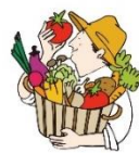
MITSUI NATURAL GARDEN

「作り人と食べる人、安心とおいしさで繋ぐ。」をコンセプトに愛をもって農作物を育てる作り人さんの『農作品』を、食べる人の皆さまへめ野菜&果物をお届け。また、国産非加熱蜂蜜『321 NATURAL HONEY』も取り扱います。ひとつひとつ全く違う味の蜂蜜をぜひお楽しみください。