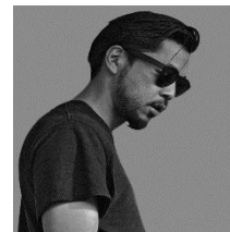
DJ JUN 15:30～