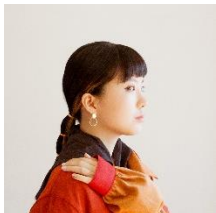
Yon Yon 13:00～