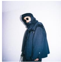
DISK NAGATAKI 15:30～