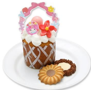
フラワーバスケットマフィン〜プレーン〜 850円