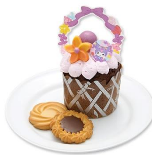
フラワーバスケットマフィン〜チョコレート〜 850円