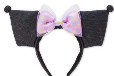
カチューシャ 各1,980円