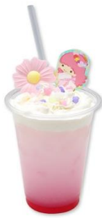
ピンクレモンフラワーソーダ 780円