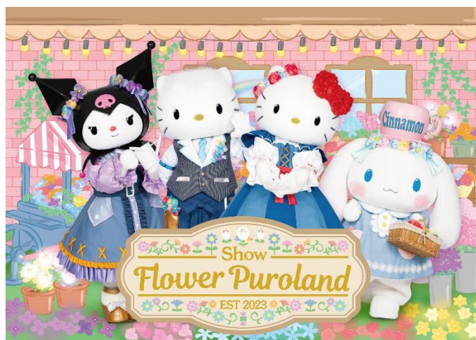
▲新作の「Show『Flower Puroland』」ビジュアル