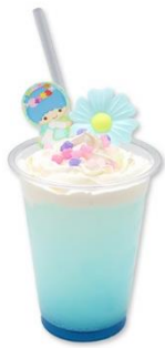
ブルーイチフラワーソーダ 780円