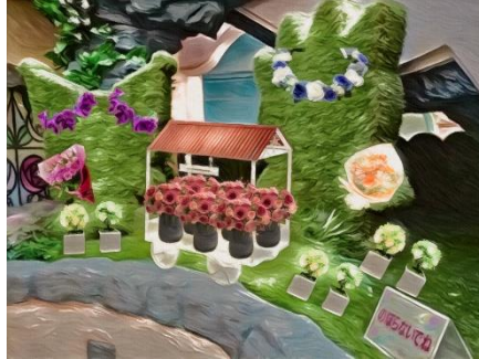
▲エシカルフラワードピアリー（2箇所）