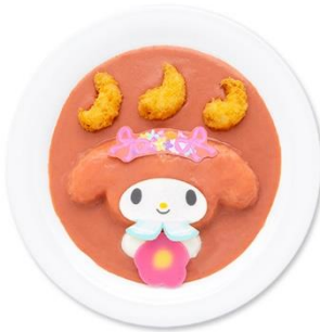
小エビフライのフラワーガーデンピンクカレー 1,500円