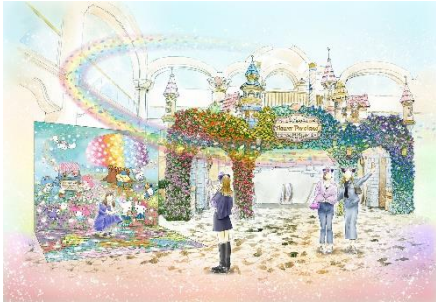
▲フラワーフオトスポット

そしてピューロランドの外にも特別なガーデンが登場。キャラクターたちが植えたお花が咲く「キャラクターガーデン」がピューロランドへの道をカラフルに彩ります。中には、ハーモニーランド（大分県速見郡日出町）にある「ウィッシュミーメルの花ガーデン」とコラボレーションした花壇も必見です。