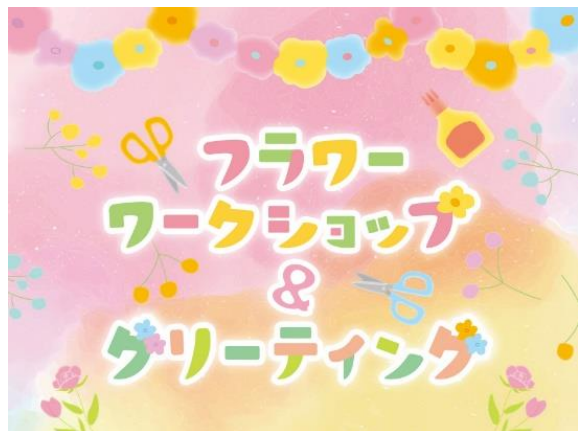
▲「フラワーワークショップ&グリーティング」ビジュアル