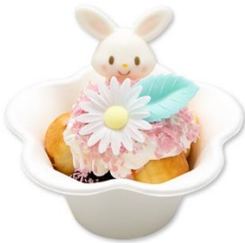
花咲く♡ プチホットケーキ 〜ブルーベリーソースがけ〜 900円