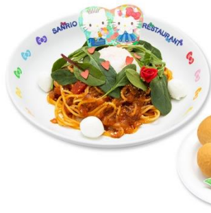
花束をお届け♡ ロマンティックパスタ ～ポロネーゼ&パンセット～ 1,550円