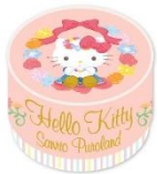
コンパイトウ 各540円