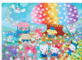
クリアファイル 各440円