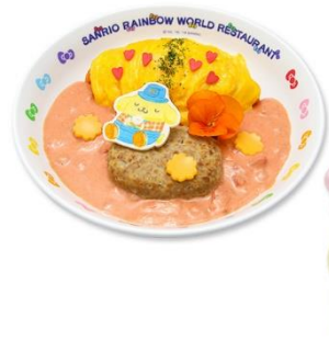
花畑でお昼寝♪トマトクリームオムライス ～デザートカップセット～ 2,100円