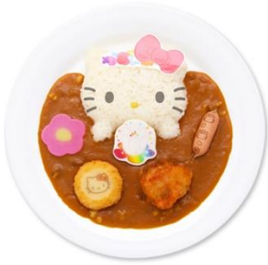
「みんな なかよく」ピューロフラワーカレー 1,500円

カラフルなお花畑をイメージした「花束をお届け♡ ロマンティックパスタ〜ポロネーゼ&パンセット〜」や「花畑でお昼寝♪ トマトクリームオムライス〜デザートカップセット〜」は可愛い見た目に加えてボリュームも満点。他にも小腹が空いたときにぴったりな「花咲く♡ プチホットケーキ〜ブルーベリーソースがけ〜」や「花冠スフレロールケーキ」など、キャラクターとお花がデザインされたメニューをお楽しみいただけます。