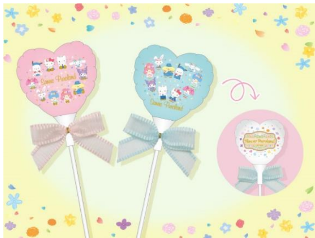
▲ Flower Purolandオリジナルデザインの「スティックバルーン」

知恵の木ステージでは新作「Show『Flower Puroland』」を上演。フローリストをイメージした新コスチュームを着たハローキティ、クロミ、シナモロール、ディアダニエルが登場します。