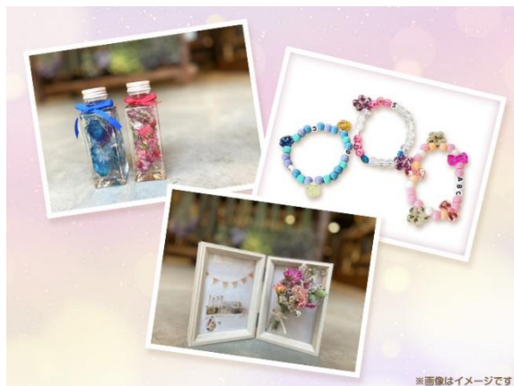
▲制作できるオリジナルアイテム(イメージ)

エシカルフラワーを使った、キャラクターをイメージしたオリジナルアイテムを作るワークショップを開催。ハローキティ、ディアダニエルをイメージしたハーバリウムやマイメロディやクロミをイメージしたフォトフレーム、シナモロールやウィッシュミーメルをイメージしたイニシャル入りプレスレットのアイテムを予定しています。オリジナルアイテム作成後は、キャラクターとの記念撮影タイムも。