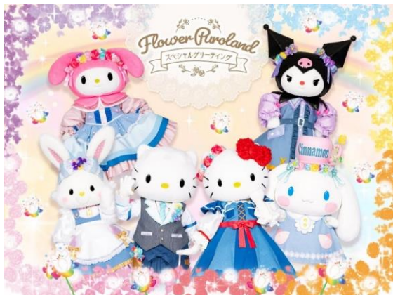
▲「Flower Purolandスペシャルグリーティング」ビジュアル