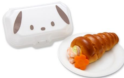
えびアボカドのフラワーブーケコロネ 850円（税込）