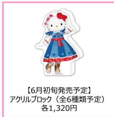
【6月初旬発売予定】 アクリルブロック（全6種類予定） 各1,320円