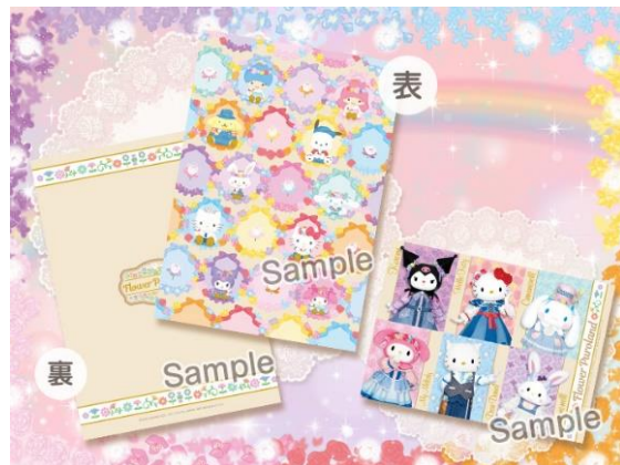
▲環境にやさしい素材を使用したオリジナルデザインのクリアファイル（A4サイズ）とカードをプレゼント

フローリスト姿のキャラクターと特別な時間を過ごせる「Flower Purolandスペシャルグリーティング」（事前予約制・有料）を開催します。それぞれ少しずつ異なるかわいい花飾りや、デニム素材を使った春らしいコスチュームも見どころ。お花やデニムを取り入れたおそろいコーデで参加すると楽しさがアップすること間違いなしです。