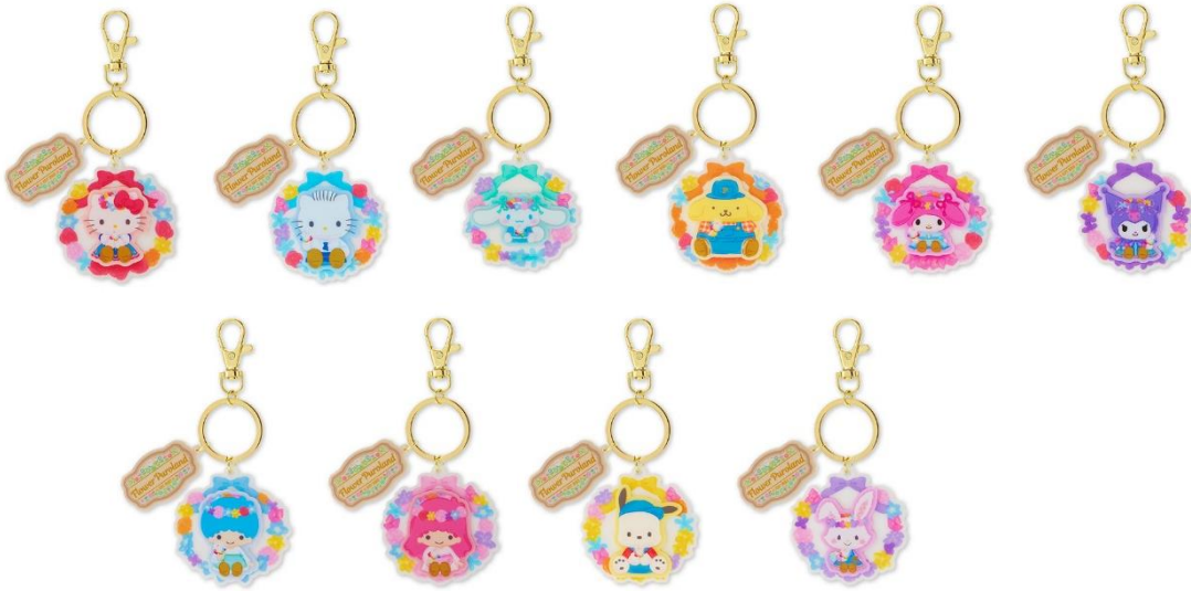
キャラクターキーホルダー 各990円