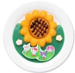
ひまわり畑の青空メンチカレー 1,500円