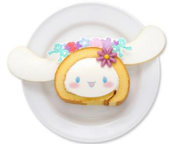
花冠スフレロールケーキ 800円