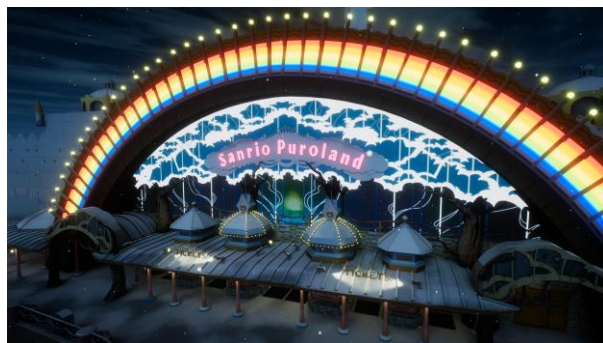
バーチャルピューロランドのエントランス