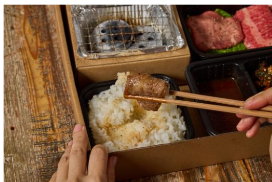
⑦ごはんやキムチと一緒に焼肉をお楽しみください