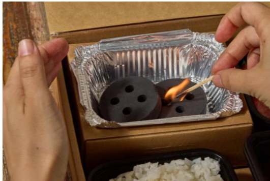
①付属の炭を袋から取り出し、アルミ皿に8の字に置き KINTAN のマッチ等で着火します。炭の隙間にマッチを入れると火が付きやすくなります