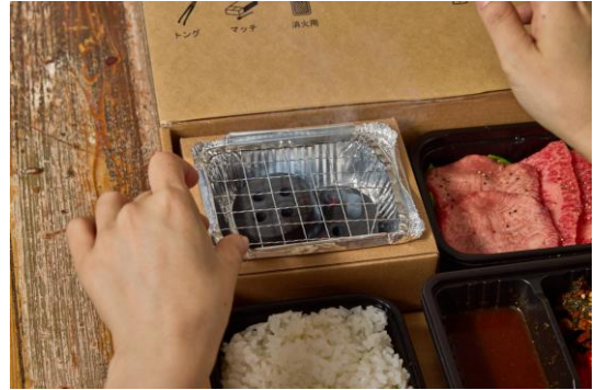
②着火後、焼き網を乗せ、火力が安定するまで1分待ちます。火のつきが悪いときは再度マッチで着火します