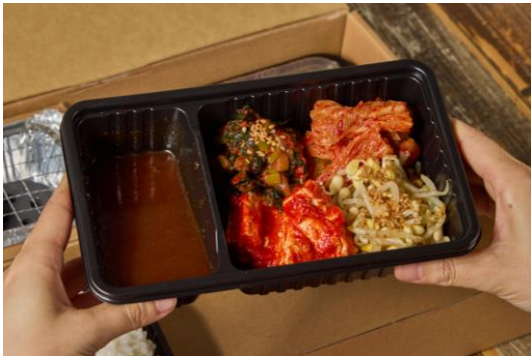
③付属の焼肉のタレをタレ皿に入れます