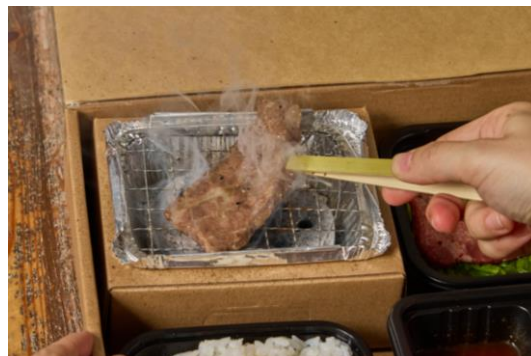
⑤肉を裏返し、しっかりと火を通します。こまめに返しながらかくと煙が少なくなります