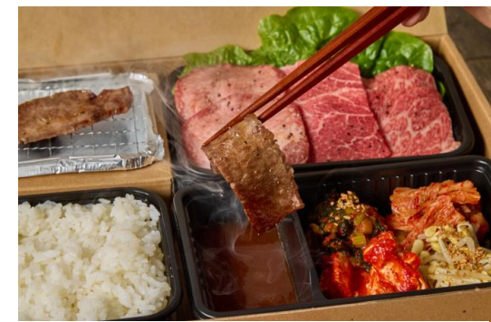
⑥焼き上がったお肉をタレにつけます