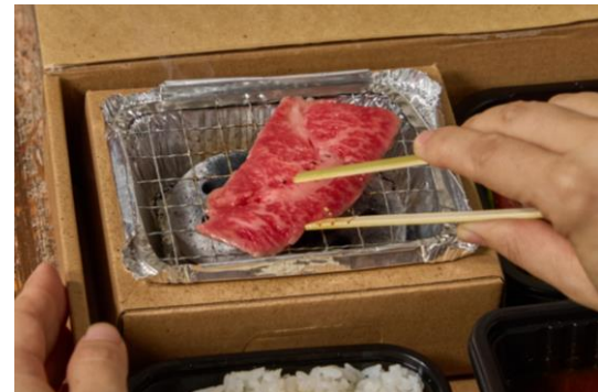
④付属の竹トングで焼き網に肉を乗せてじっくりと焼きます