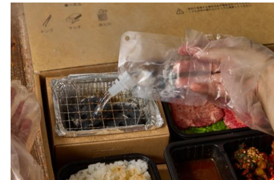
⑧食後は付属の容器にたっぷりと水を入れて炭を消火します