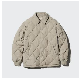
パフテック キルティングジャケット ¥6,990