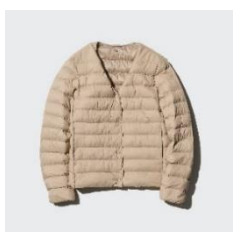
パフテック コンパクトジャケット ¥5,990