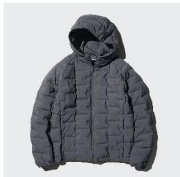
パフテックパーカ ¥6,990