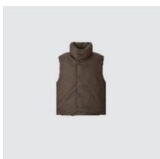
UNIQLO U パフテック ノンキルトベスト ¥6,990