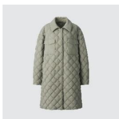
UNIQLO :C パフテック キルトコート ¥9,990