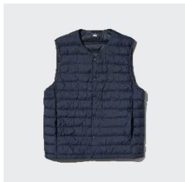
パフテック コンパクトベスト ¥3,990