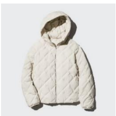
パフテックパーカ ¥6,990