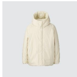
UNIQLO U パフテック ボリュームパーカ ¥12,900