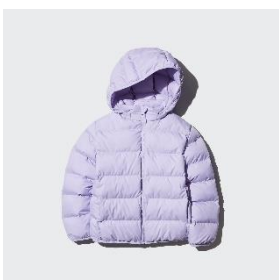
パフテック ウオッシュャブルパーカ ¥3,990