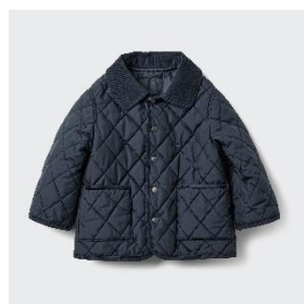
パフテック キルトジャケット ¥2,990