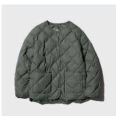
パフテック リラックスジャケット ¥6,990