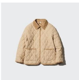
パフテック キルトジャケット ¥2,990