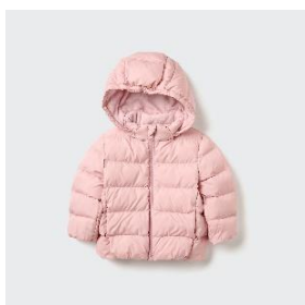
パフテック ウオッシュャブル パーカ ¥3,990