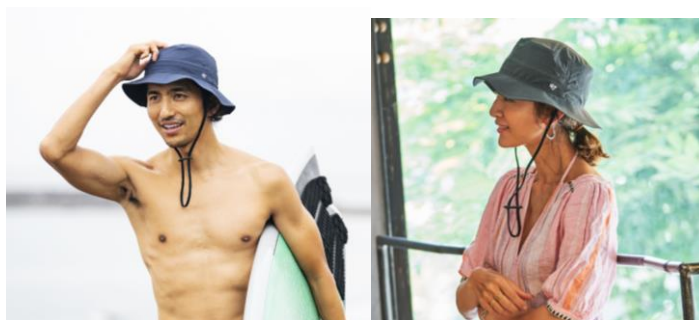
Solotex® Stretch Haze '47 Adventure HAT Navy