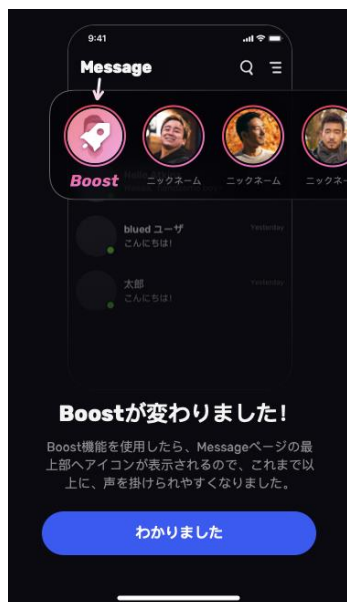
Boost機能と Messageページが連携。